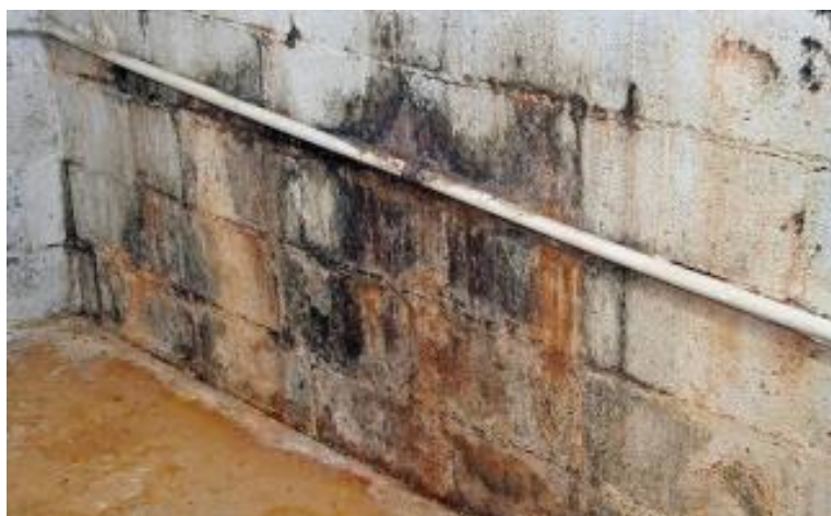
Figura 3 – Momento que Ocorre a Umidade Acidental

Já a umidade ocasionada por vazamentos em sistemas de tubulação de gás, tubulações de águas pluviais, entre outros (Figura 3) está ligada diretamente com a idade destes elementos e a manutenção que deve ser feita no tempo certo, a não atenção a esses pequenos detalhes que é a manutenção acaba agravando a situação e pode haver uma grande possibilidade do aparecimento dessas umidades (RIGHI, 2009).