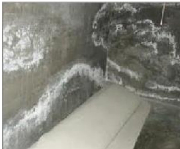
Figura 6 – Umidade devido a fenômenos de higroscopicidade

Muitos materiais de construção possuem sais solúveis em água. Também os solos, especialmente aqueles ricos em matéria orgânica. Estes sais, quando depositados em ambiente secos não oferecem problemas. No entanto, quando existir umidade, os sais se dissolvem e migram juntamente com a água até a superfície, onde se cristalizam (OLIVEIRA, 2015).