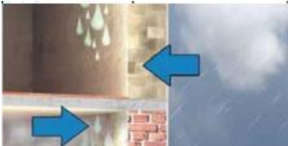
Figura 2 – Momento que Ocorre a Condensação

ventilação. Então a água condensa-se nas paredes e não existe ventilação para secá-las onde o resultado é a formação de água nos tetos e paredes (RIGHI, 2009).