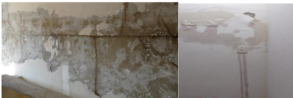
Figura 1 – Umidade Trazida por uma Forma de Infiltração

Contando que esse agente de umidade pode ocorrer ou não com as chuvas. A umidade por infiltração (Figura 1) é frequente em subsolos (garagens, porões) que se encontram abaixo do nível do lençol freático, o simples fato de ocorrer precipitação, não implica em patologias de umidades com esta causa. (VERÇOZA,1991).